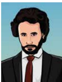
Matthew , Assistant Personnel de Jésus

Collecteur d'impôts public durant son premier passage sur terre, Il convient parfaitement que Matthew fasse partie de la team du JC.